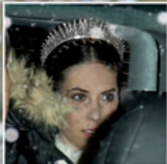
TATIANA SANTO DOMINGO ET ANDREA CASIRAGHI

CHARLOTTE CASIRAGHI ET GAD ELMALEH UNE FAMILLE HEUREUSE À GSTAAD Premières photos du couple avec Raphaël